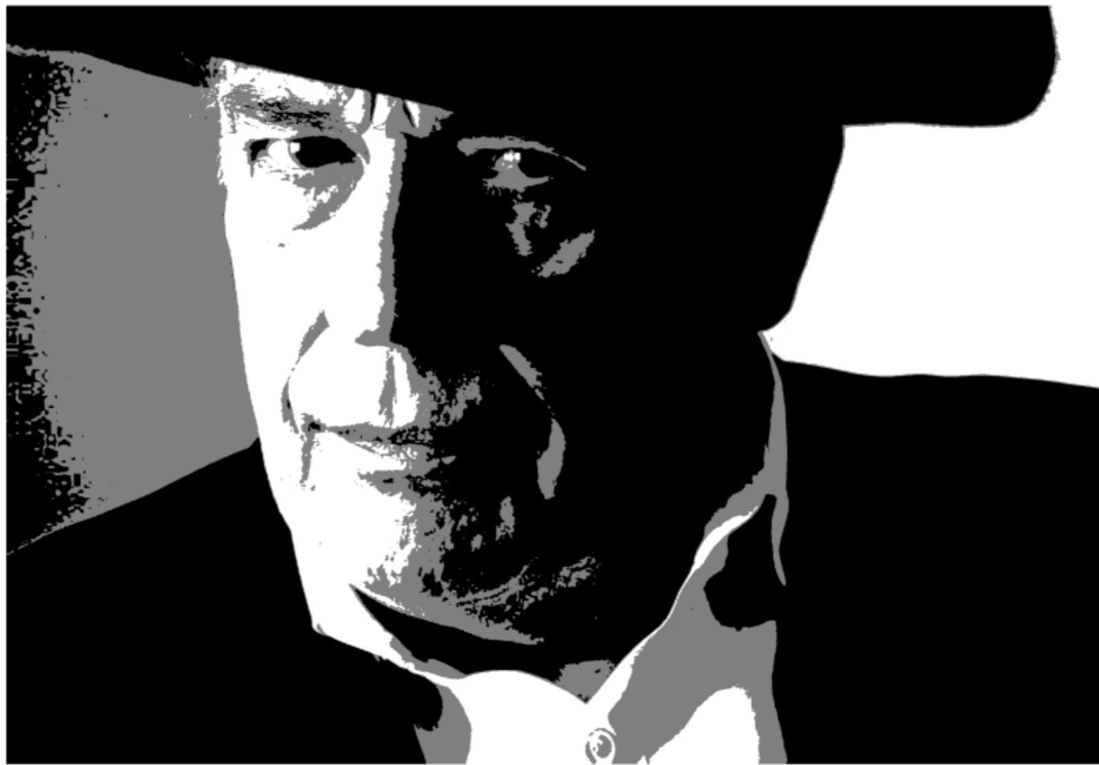
Als John Brockman drei Jahre alt war, kündigte er an: „Ich will nach New York!“ Dort zieht er seit Jahrzehnten die Strippen im geistigen Leben.

Sei aufregend, anregend, überzeugend: Das fordert John Brockman von sich und anderen. Der wohl wichtigste Buchagent der Welt versammelt in seinem Internetsalon „Edge“ die Cyber-Elite. Ein Besuch beim Mann der Dritten Kultur.